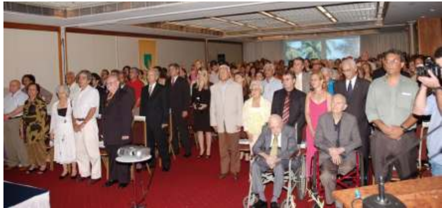
Homenagem da ABRAPP reuniu aposentados de todo o País

A solenidade, que já se tornou uma tradição em nosso calendário, pela própria importância que dirigentes e profissionais de fundos de pensão atribuem à data. Afinal, os aposentados e pensionistas são a razão da existência dos fundos de pensão.