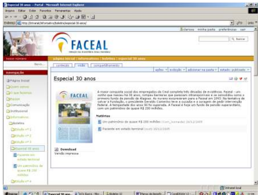
Os boletins informativos da Faceal também têm versão online