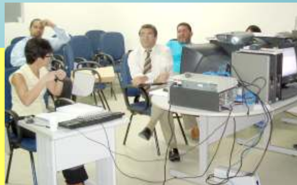
Colaboradores são capacitados durante treinamento

FACEAL moderniza seus sistemas informatizados