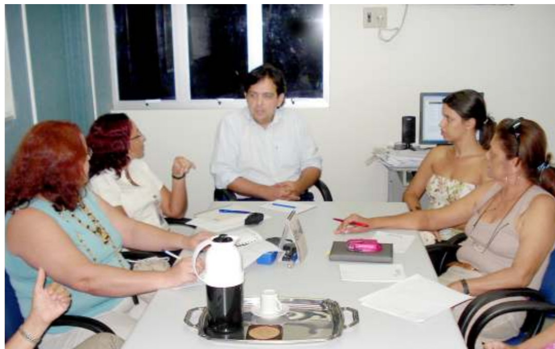
Seguridade busca medidas para convencer participantes da importância do recadastramento

Os 268 participantes, lotados no interior, que ainda não fizeram o recadastramento ou estão com documentações pendentes, podem procurar nossa equipe de atendimento na sede da FACEAL, em Maceió, e ajudar a garantir uma melhor qualidade nos nossos serviços. O bom funcionamento da FACEAL depende de cada participante.