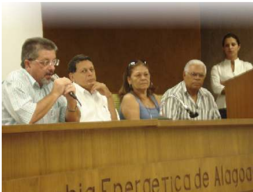
Presidente da CEAL fala durante posse dos novos conselheiros da FACEAL

Órgão máximo da estrutura organizacional. É responsável pela definição da política geral de administração da entidade e de seus planos de benefícios.