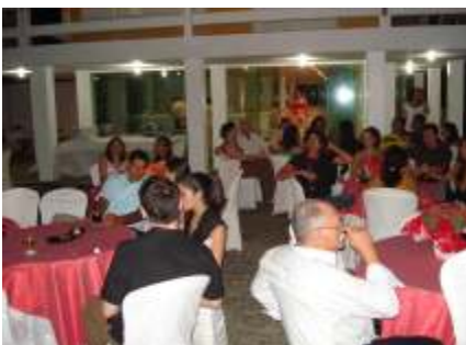
Colaboradores e familiares durante a festa