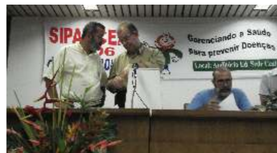
Comissão apura votos e anuncia novos conselheiros