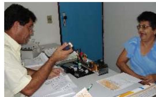
Atendimento dinâmico cativa participantes