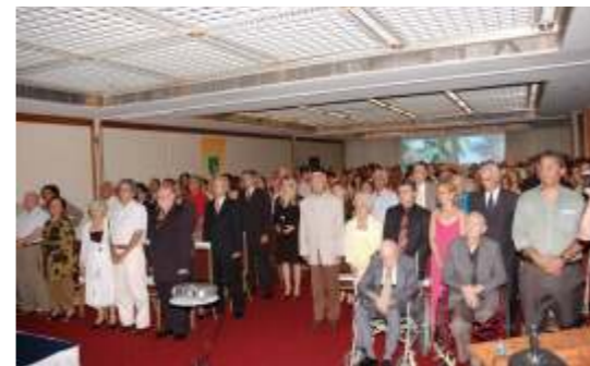
Entidades homenageiam aposentados