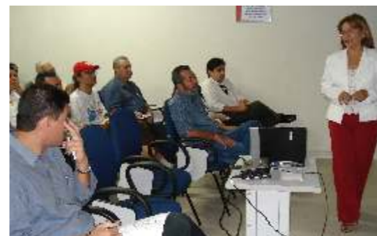
Lançamento da Cartilha dos Direitos do Idoso